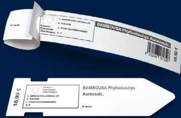
Étiquette collier et pic