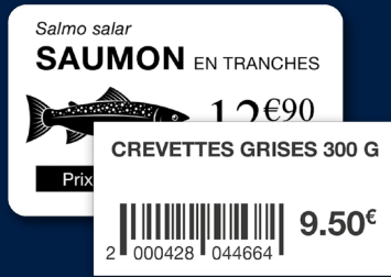
Étiquette produit et code-barre