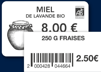
Étiquette produit et code-barre